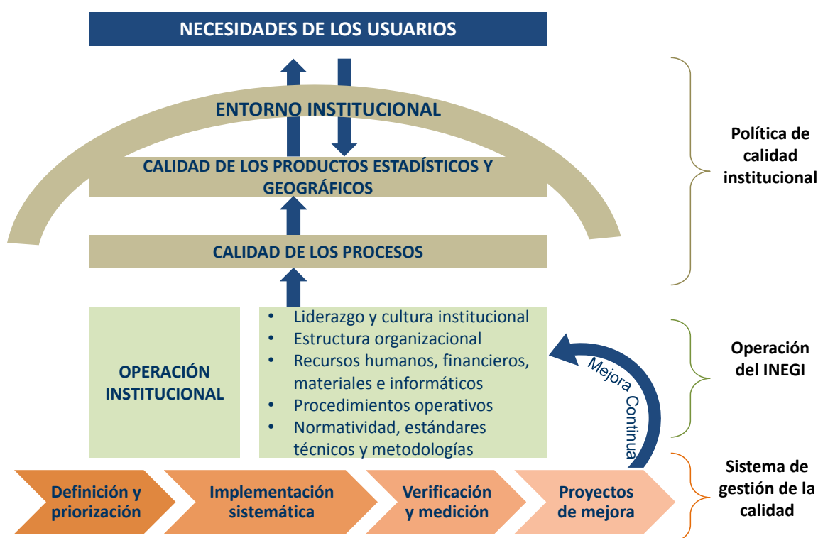
Figura 1: Esquema integral para el aseguramiento de la calidad

conceptualización y medición de la calidad de la información estadística y geográfica. En línea con las recomendaciones internacionales y la normatividad existente, la Política establece tres dimensiones para el aseguramiento de la calidad: el entorno institucional, los productos estadísticos y geográficos y los procesos subyacentes. Como tercer elemento del esquema integral, el Sistema de Gestión de la Calidad Institucional establece los medios, mecanismos y actividades a través de los cuales se gestionará el aseguramiento de la calidad. Finalmente, para que el esquema integral de calidad funcione es indispensable ligar las acciones para el aseguramiento de la calidad, especialmente, los proyectos de mejora con la operación del INEGI que abarca la cultura y estructura organizacional, la planeación y el liderazgo, los recursos humanos, financieros, materiales e informáticos, así como los procedimientos operativos, la normatividad, estándares técnicos y metodologías.