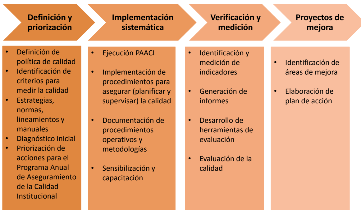
Figura 4: Sistema de Gestión de la Calidad Institucional